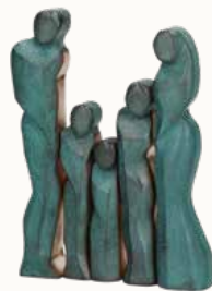
Kombination Paar mit Kind 1, 2 und 4