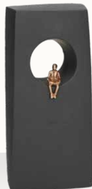
„Zeit zu leben“

Größe: 9 x 19 x 4,5 cm Art.-Nr. 1-118505