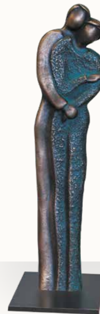
„Zusammen glücklich sein“