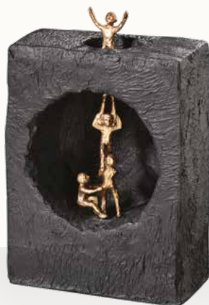
„Sich gegenseitig helfen“