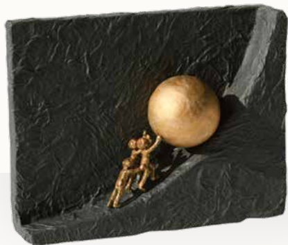
„Zusammen etwas bewegen“