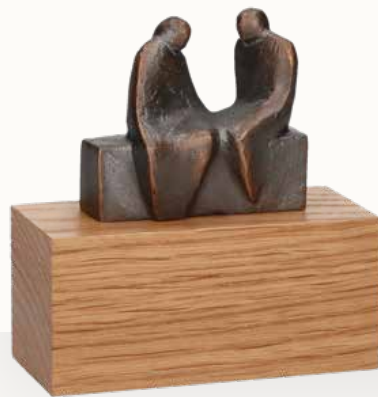
„Paar“ mit separatem Holzsockel

Größe: 10 x 16 x 4,5 cm Größe Holzsockel: 10 x 4,5 x 4,5 cm Art.-Nr. 1-118947