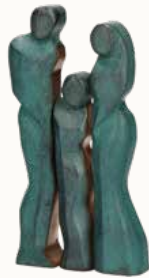
Kombination Paar mit Kind 4