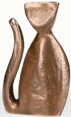
„Katze“ Größe: 12 cm Art.-Nr. 1-119517