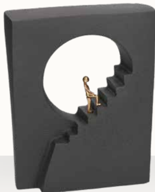
„Schritt für Schritt hinauf“

Größe: 14 x 17,5 x 5 cm Art.-Nr. 1-118504