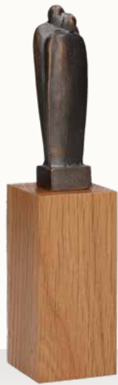
„Paar“ mit separatem Holzsockel

Größe: 4,5 x 19 x 4,5 cm Größe Holzsockel: 4,5 x 10 x 4,5 cm Art.-Nr. 1-118954