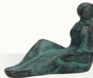
„Back to back“