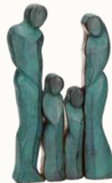
Kombination Paar mit Kind 3 und 2