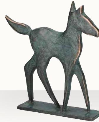
„Fohlen“ Größe: 17,5 cm Art.-Nr. 1-119515