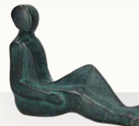
„Back to back“