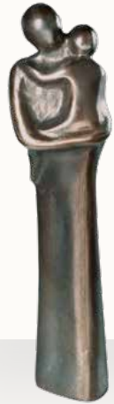
„La Amore di Madre“