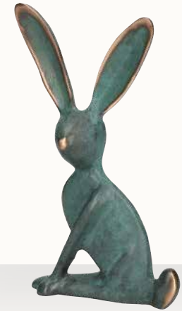
„Hase“ Größe: 20,5 cm Art.-Nr. 1-119516