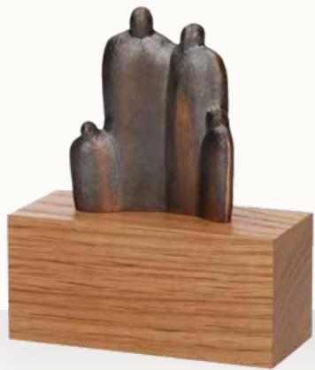
„Familie“ mit separatem Holzsockel

Größe: 10 x 17 x 4,5 cm Größe Holz-Sockel: 10 x 4,5 x 4,5 cm Art.-Nr. 1-118946