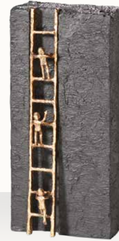
„Nach oben streben“