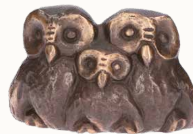
„Eulenfamilie“ Größe: 9,5 x 6,5 cm Art.-Nr. 1-407474