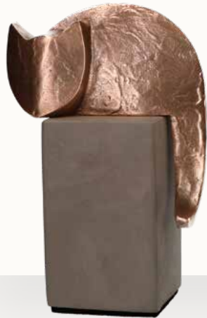
„Katze“ mit separatem Beton-Sockel Größe: 16 cm Größe Sockel: 6 x 10 x 6 cm Art.-Nr. 1-119511