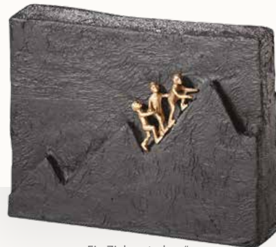
„Ein Ziel anstreben“