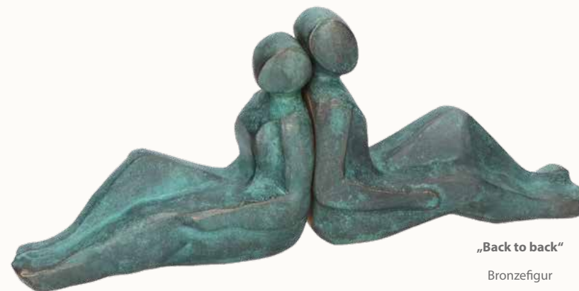
„Back to back“