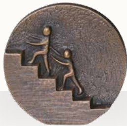
„Gemeinsam nach oben“