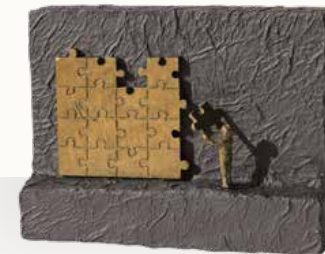
„Seinen Teil beitragen“